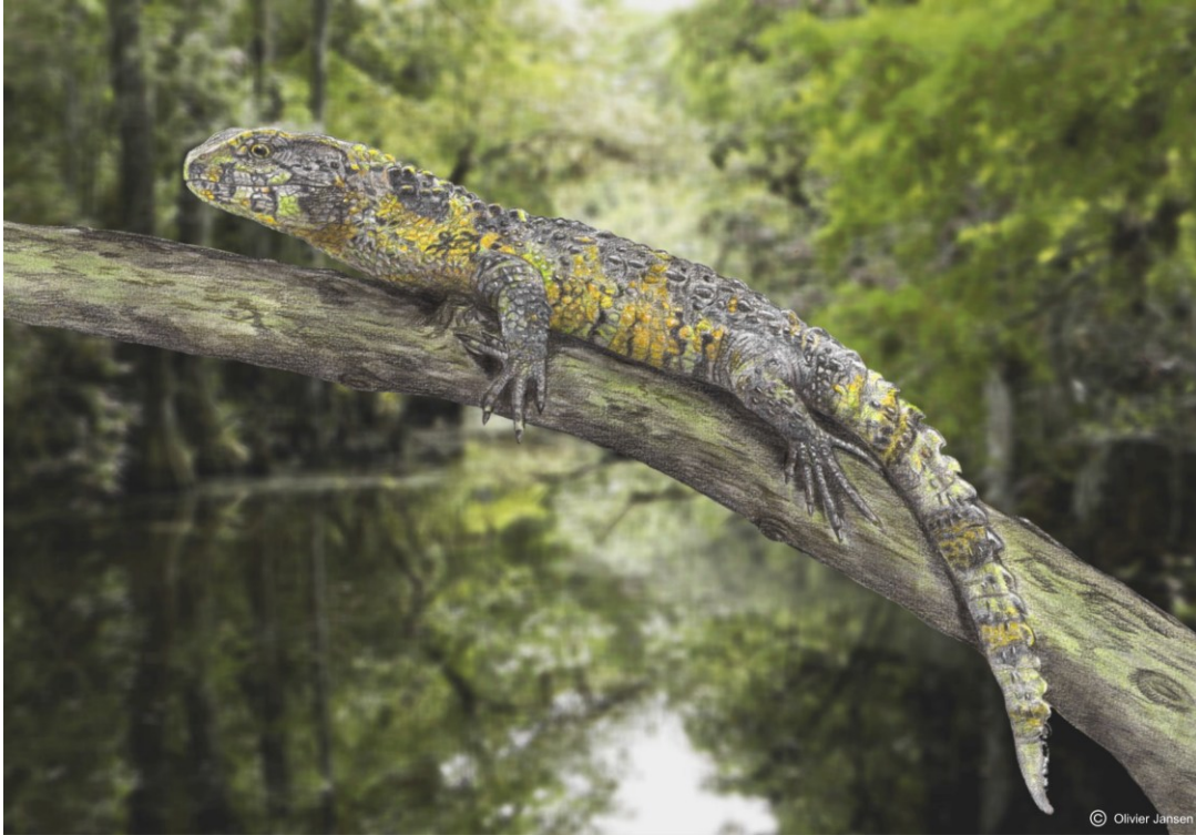
The new pan-shinisaur ( Acutodon villeveyracensis ) from the lower Campanian of Villeveyrac (Hérault, France), basking in the sun on a branch overhanging the river and ready to dive into the water to catch its next meal. Palaeoartistic reconstruction by Olivier Jansen, lead author of the study.